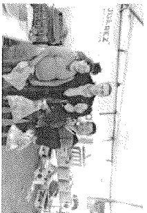
Los vecinos se muestran agradecidos por el apoyo que les ha brindado el municipio.

La inversión para la construcción de obra de concreto fue de 3 millones 735 mil 221 pesos en un tramo de 1 mil 50 metros cuadrados que ayudará mejorar la calidad en el pavimento de la avenida y en el acceso principal de la colonia zonas mencionadas.