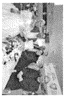
Pasa por mostrar albor de union presidente municipal en momento

El Gobierno de Juárez a través de DIF municipal en coordinación con autoridades estatales, llevaron a cabo la entrega de 110 kilos de matrimonio a parejas juareñas.